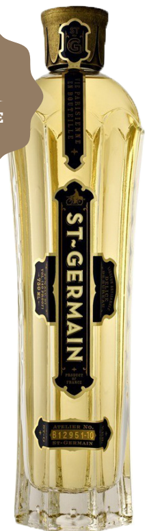
LIQUEUR SAINT-GERMAIN 70 cl - 20° - 140232