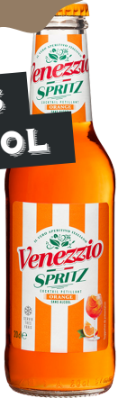
VENEZZIO SPRITZ 20 cl x 24 - 220100