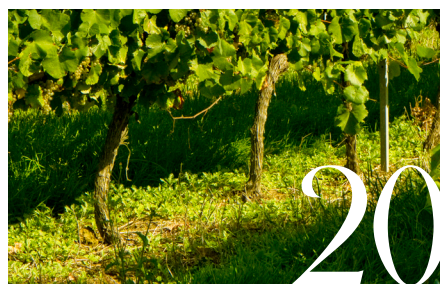
LA CAVE DE CASAS