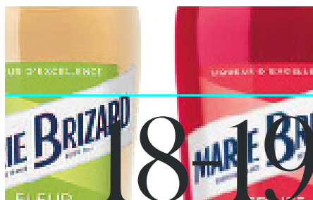
DÉCOUVREZ NOTRE GAMME DE LIQUEURS POUR VOS COCKTAILS