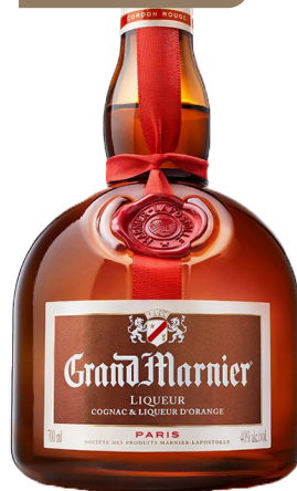
GRAND MARNIER 70 cl - 40° - 160920