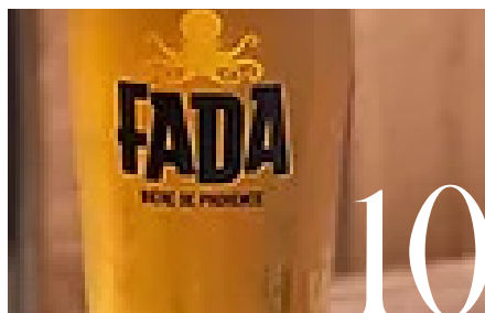
DÉCOUVREZ TOUTE LA GAMME FADA