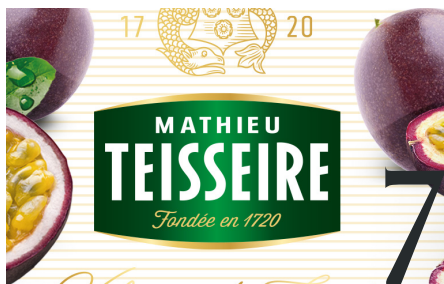
ZOOM SUR... TEISSEIRE