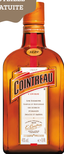
COINTREAU 70 cl - 40° - 1003