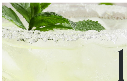
LE COCKTAIL DU MOIS : LE DAIQUIRI