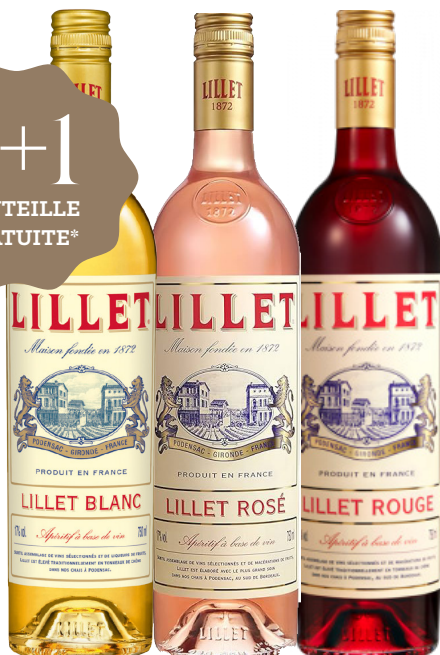
LILLET 75 cl - 17° - 11,81 €