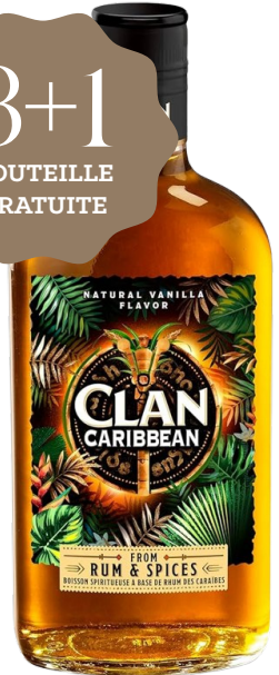
CLAN CARIBBEAN SPICED 70 cl - 35° - 160499