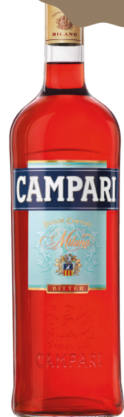
CAMPARI 100 cl - 25° - 872