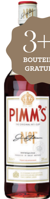
PIMM'S N°1 70 cl - 25° - 1066